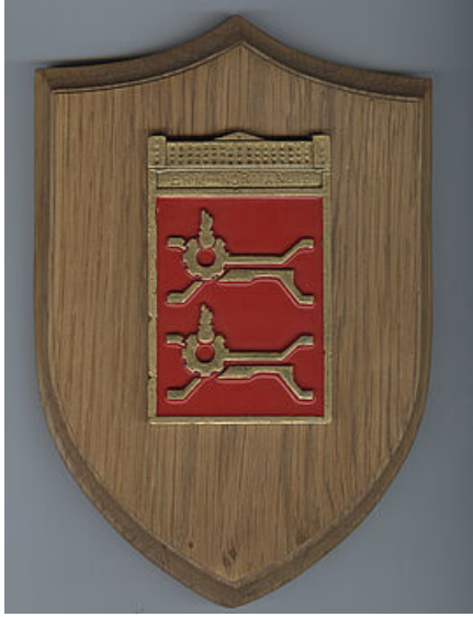
Insigne du régiment ERM Normandie - Archives Municipales de Petit-Quevilly