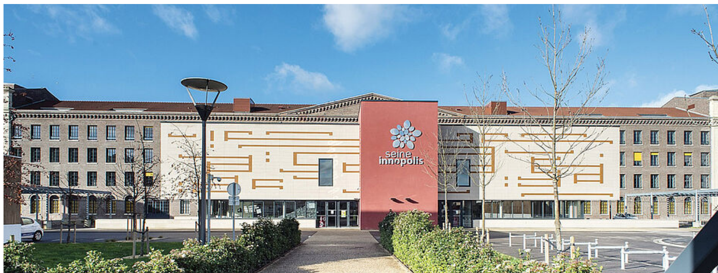
Bâtiment de Seine-Innopolis, ancienne filature La Foudre

Seine Innopolis, pôle des technologies de l'information et de la communication, a ouvert ses portes en centre-ville en 2013. Son attractivité est indéniable : plus de 80 entreprises y sont installées et 300 emplois créés, de l'ingénierie informatique à la télémédecine, du studio de jeux vidéo à l'agence de communication. Seine Innopolis est un vivier de jeunes talents, un lieu d'échanges incontournable !